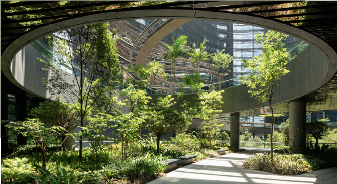
Marina One Singapur, KEIM Concretal-Lasur; Bild links: Alnatura Campus Darmstadt, KEIM Lignosil-Inco

KEIM ist seit jeher Vorreiter in punkto Nachhaltigkeit und setzt sich mit der Zertifizierung von 65 Produkten aus 4 Produktgruppen an die Spitze der Baubranche. Das sind über 80% des KEIM Farbabsatzes. Alle Produkte erhalten die Cradle to Cradle Certified®-Zertifizierung in Silber. Die Produkte und Prozesse wurden im Rahmen der Zertifizierung in den folgenden 5 Kategorien bewertet.